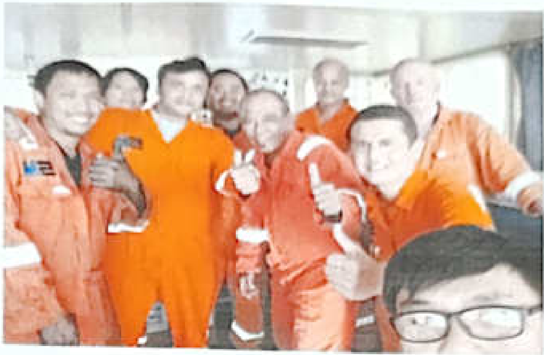
Lampiran 4. Foto Crew MV. Stanford Swan