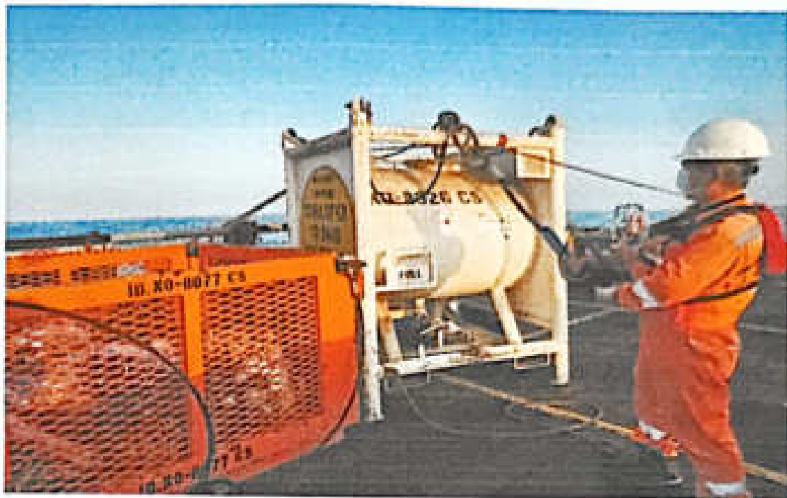
Lampiran 5. Passenger Transfer dari kapal MV. Stanford Swan ke Platform