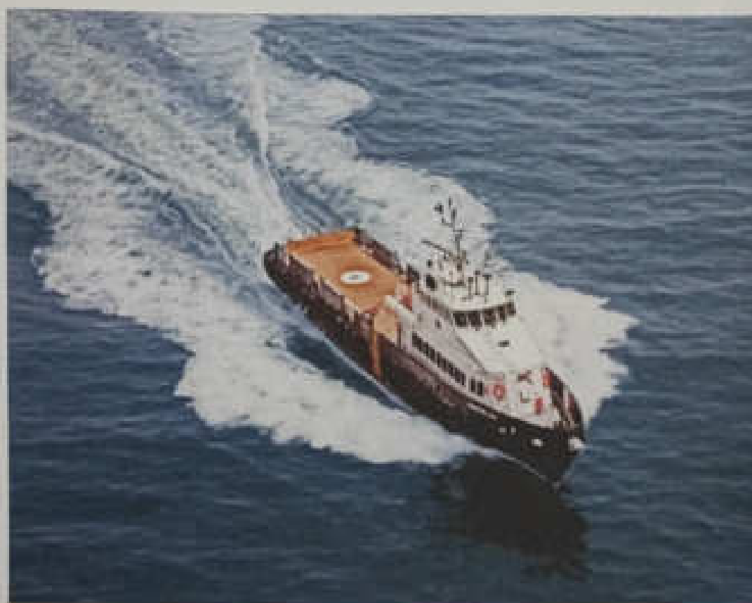
Foto MV. Stanford Swan