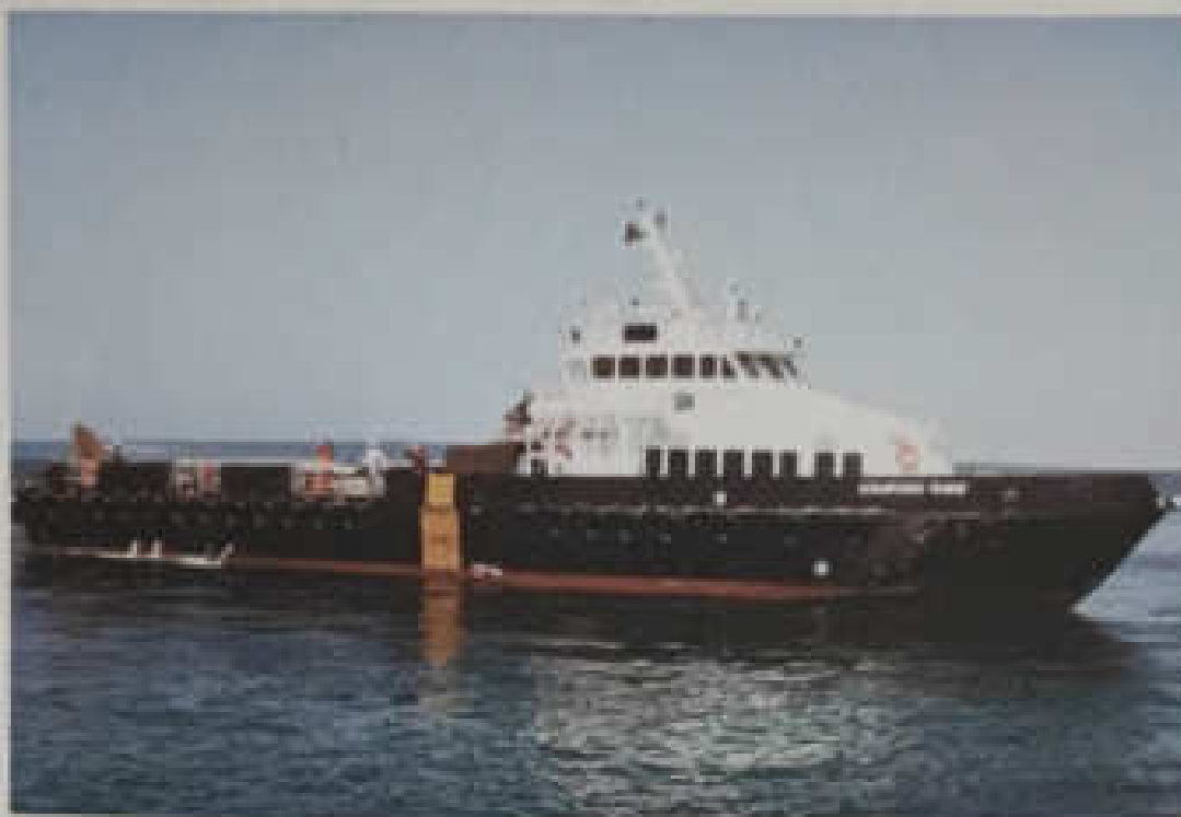
Lampiran 2. Foto MV. Stanford Swan